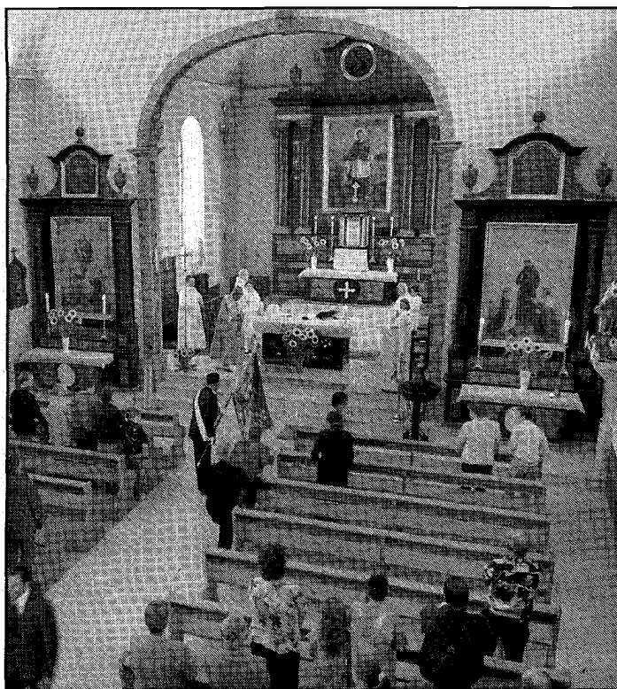
La Suisse religieuse est particulièrement à l'honneur dans le troisième tome du Dictionnaire historique.